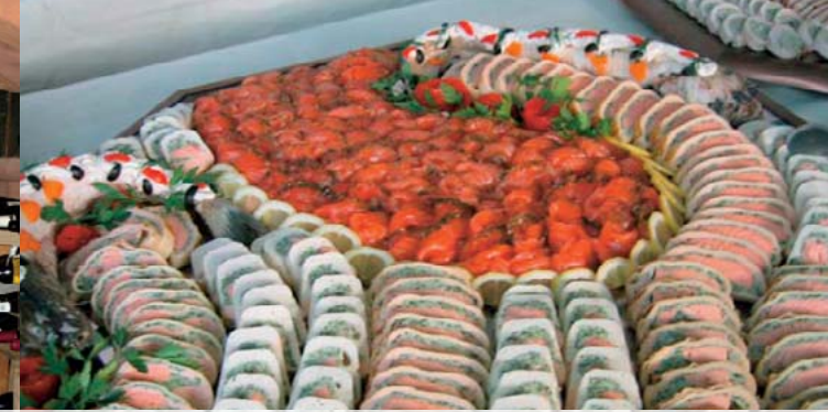
Catering – Full Service für Ihr Business

W eit über die Grenzen Frankfurts hinaus bekannt ist unser Restaurant Maingau Stuben. Hier erwarten Sie exzellente Qualität, perfekter Service und eine gastliche Atmosphäre. Perfekt eingedeckt in feinem Tuch heißt es hier: Platz nehmen und sich wohl fühlen. Und das fällt nicht schwer, denn der Küchenchef der Maingau Stuben, der bereits in renommierten Häusern gearbeitet hat, verleiht jedem Detail Charakter. Genießen Sie unsere kulinarische Vielfalt - Dorade auf Zitronenspinat oder xxx-Fleisch sind gelungene Kombinationen, selbstverständlich mit ausschließlich frischen Zutaten zubereitet. So viel Liebe zum Detail beschert uns regelmäßig seit vielen Jahren zwei Kochmützen der französischen Gourmetbibel Gault Millau sowie mehrere Feinschmecker-F's - und Ihnen einen unvergleichlichen Genuss.