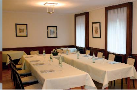
Ob Städtereise oder Geschäftsstermin