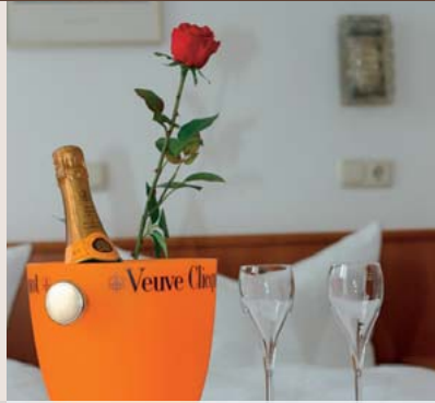
Tagen mit Charme