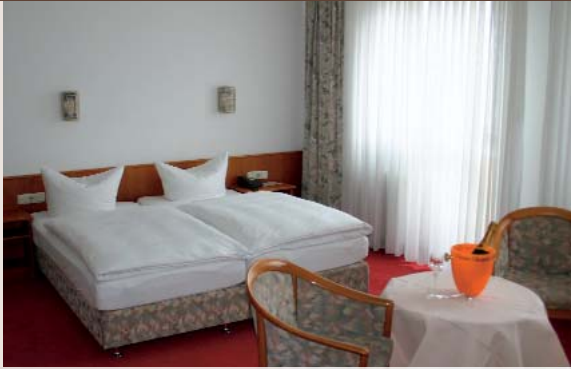
Wohnen in angenehmer Atmosphäre

Zentral wohnen in einem liebevoll geführten Privathotel